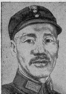
CHIANG KAI SHEK Presidente de la República China