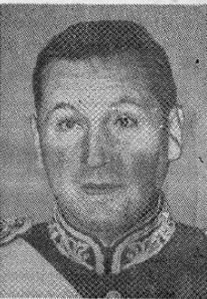
JUAN DOMINGO PERON Presidente de la Rep. Argentina